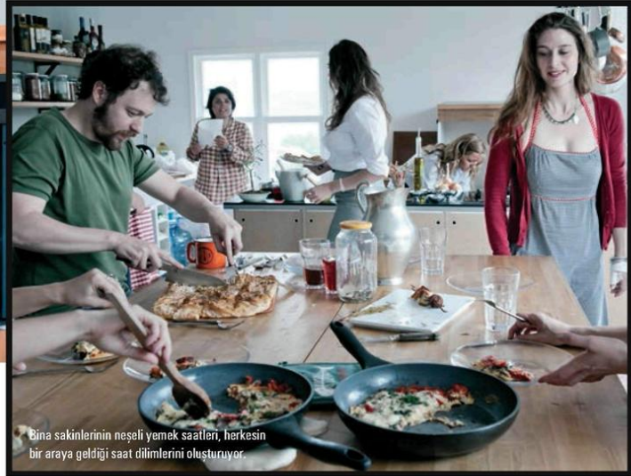
Bina sakinlerinin neşeli yemek saatleri, herkesin bir araya geldiği saat dilimlerini oluşturuyor.

Yapım Selmin Eser.