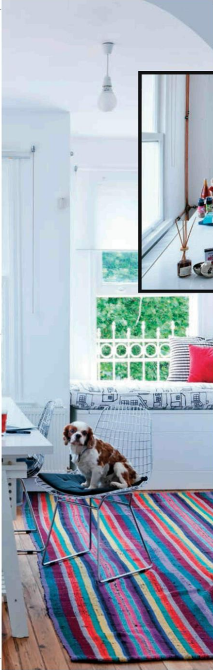
Refika Birgül'ün renkli detaylarla hareketlendirilen çalışma odası.

272_277_MF195.qxd 7/25/11 6:38 PM Page 275